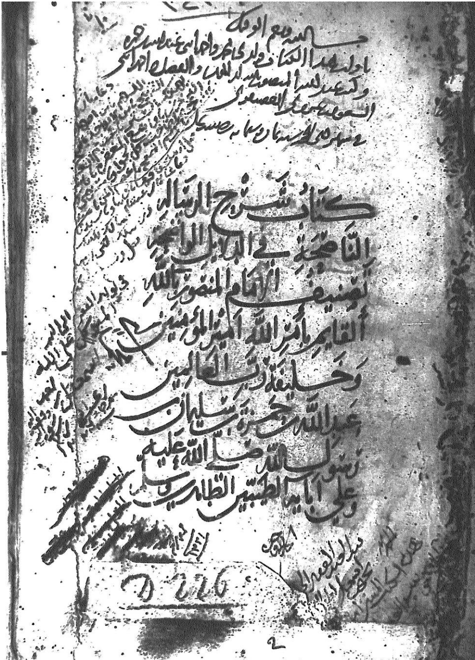
صفحة عنوان شرح الرسالة الناصحة من مكتبة الأمبروزيانية في إيطاليا (برقم D226)؛ وهي التي أثبتتها الزركلي

في أعلامه. وأعلاه قيد مناوله قريب من قيد المناولة في النسخة العامة