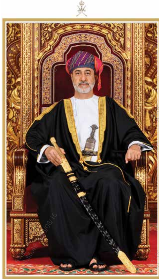
السلطان هيثم بن طارق المعظم حفظه الله ورعاه